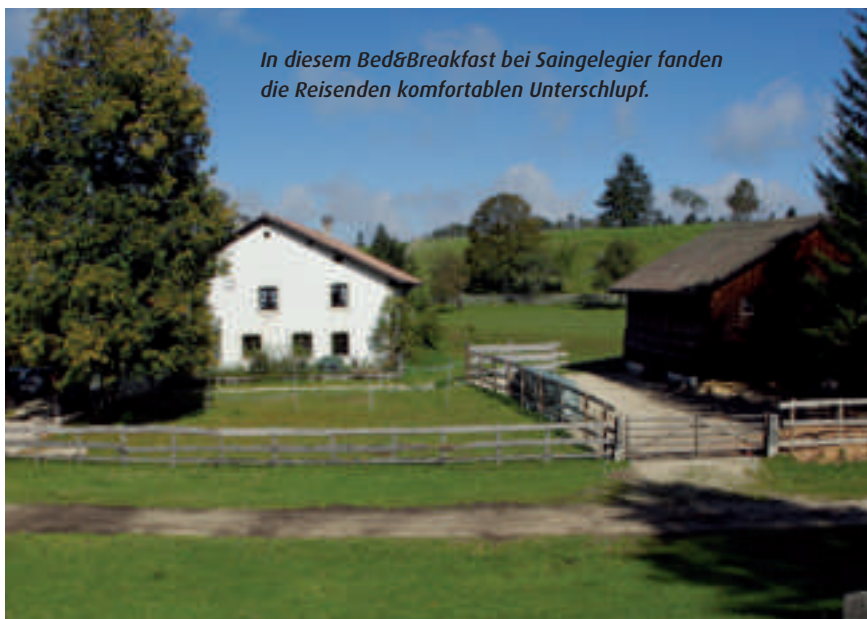
In diesem Bed&Breakfast bei Saingelégier fanden die Reisenden komfortablen Unterschlupf.

Ihr Ritt quer durch die Schweiz führte das Quartett in der vierten Woche durch Couvet, Les Rochat, Mauborget und Bullet. In der Romandie ist die Jurakette relativ hoch, Pferd und Reiter bewegten sich auf einer Höhe von 1100 und 1400 Metern über Meer. Dann wurde der Wetterbericht zum ersten Mal schlecht, Schnee, Regen und Wind waren angesagt. Deshalb beschlossen Rauber und Aschwanden, den Jura zu verlassen und auf kürzestem Weg zum Genfersee zu reiten. Keine gute Idee. Die Gegend ist stark überbaut und unzählige Zäune und Strassen machten den Vier das Leben schwer. «Trotz der Schönheit der goldenen Rebberge fehlte uns der Jura.» In Arnex-sur-Orbe beschloss