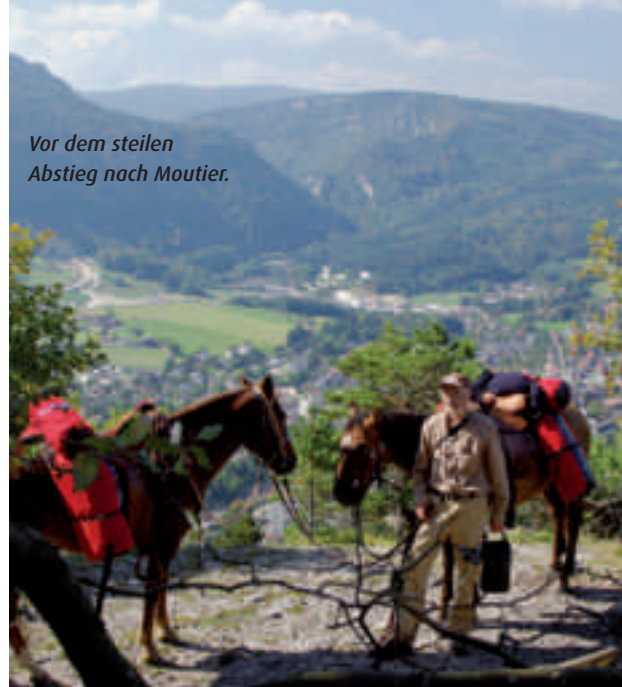
Vor dem steilen Abstieg nach Moutier.