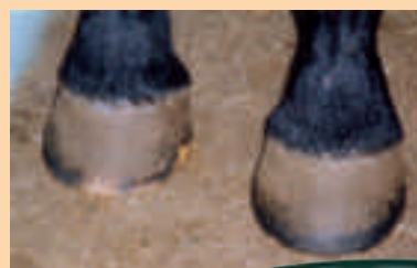
Dezember 2003: Nach 8 Monaten Kur mit Atcom HUF-VITAL®