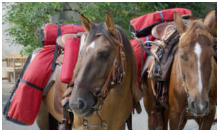
Die beiden Criollos Chapparon und Olga erwiesen sich als zuverlässige Weggefährten.