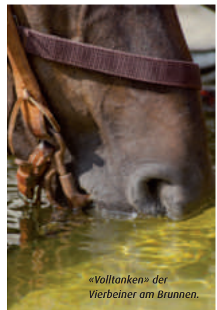
«Volltanken» der Vierbeiner am Brunnen.