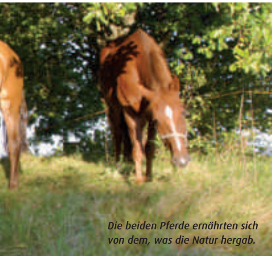
Die beiden Pferde ernährten sich von dem, was die Natur hergab.

rüstete ich einmal einen Tag lang Randen, ein andermal versetzten wir ein Gartencheminee oder luden Heuballen ab», erzählte Aschwanden. Manchmal bot ein Bauer den beiden ein Bett an, einmal übernachteten sie in einem Tipi, ein andermal in einer Naturfreundehütte.