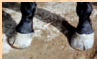
Mai 2003: Vor der Fütterung mit HUF-VITAL®